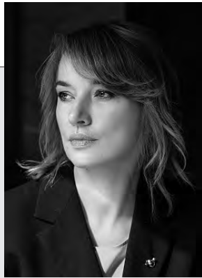
Народна депутатка Олена ШУЛЯК.

Зміни в законодавстві з 1 листопада Житло, отримане за програмою «ЄВідновлення», не можна продавати п'ять років