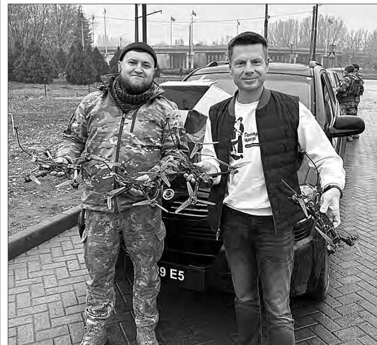
Олексій Гончаренко та офіцер 17-ї танкової бригади.